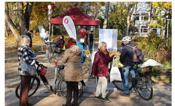
Beteiligungspavillon am Bouleplatz

Weiteren konnte über einen längeren Zeitraum noch Äußerungen im Rahmen der Sprechstunden, dem Tag der Bürgerinformation, per E-Mail oder telefonisch geäußert werden. Die Zusammenfassung der umfangreichen Beteiligung sind nun Teil einer Ausschreibung für die Planungsleistungen zur Bearbeitung durch ein Landschaftsplanungsbüro.